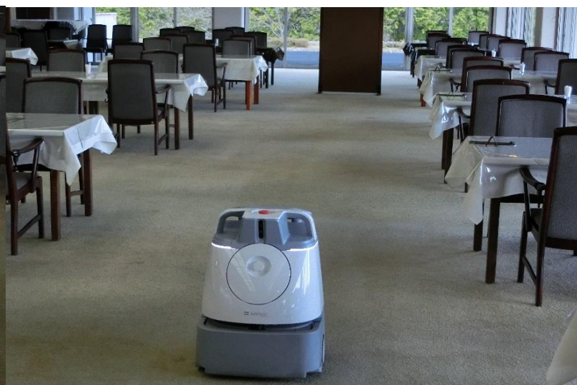
◇全テーブルにビニールシートを設置し、お客様使用後毎に 消毒 しております。

空調機に安定化二酸化塩素剤を設置による 館内空間除菌 及び、館内の換気も徹底しております。