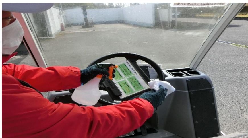
◇使用後のカートは、 毎日消毒作業 を実施