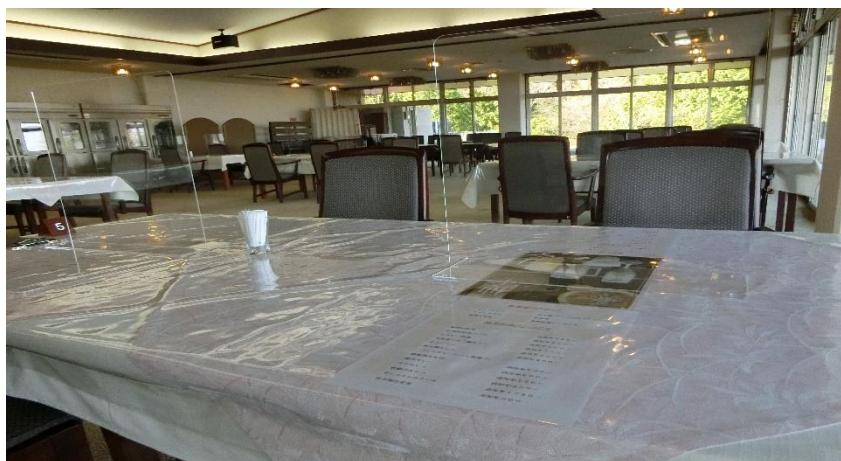
◇飛沫対策 アクリルボード を全テーブルに設置 メニューもビニールシート内に可視化しました。

また、自動掃除機ロボットによるカーペットの 隠れダスト大幅軽減 により、ウイルス飛散防止にも寄与しています。