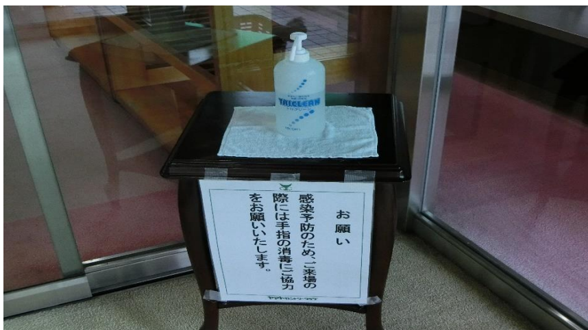
◇館内10か所に消毒液を設置