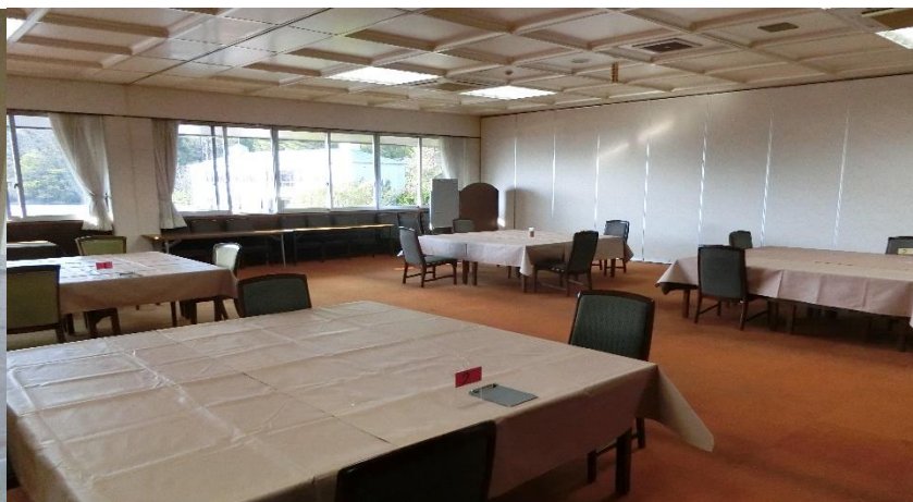
◇コンパルルームも換気と消毒の徹底。