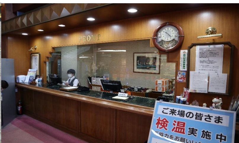
◇フロントに飛沫対策ボード設置